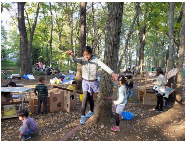
ジップラインで綱渡り